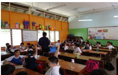
Rajah 2. Pembahagian Kumpulan. Setiap kumpulan tiga permata. Sekiranya tingkan laku murid-murid adaian baik sepanjang P&P yang dijalankan untuk satu sesi, maka satu permata akan diberikan kepada kumpulan tersebut. Manakala,

Seterusnya, saya memperkenalkan satu papan ganjaran (Rajah 1) kepada murid-murid dalam kelas. Melalui papan ganjaran ini, terlebih dahulu saya akan membahagikan murid-murid ke dalam 9 kumpulan kecil (Rajah 2). Setiap kumpulan mempunyai nama kumpulan tersendiri yang berlandaskan kepada nama animasi kartun. Antara nama yang digunakan: Angry Bird , Ben10 , Pokemon , DragonBall Z , Bleach dan sebagainya.