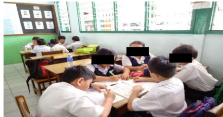
Rajah 10. Murid-murid melaksanakan aktiviti dalam kumpulan secara baik dan teratur.( Sesi P&P keempat).

Selain itu, saya turut menemu bual dua orang guru di sekolah tersebut. Berikut merupakan transkrip temu bual bagi temu bual dengan guru kelas tahun tiga.