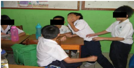
Rajah 9. Murid-murid membuat bising dan bermain dengan rakan-rakan. (Sesi P&P pertama).

Untuk menyokong data-data pemerhatian saya, rakaman visual yang telah dibuat berikut juga dapat memberikan gambaran tentang keberkesanan kaedah ganjaran dan hukuman tersebut.